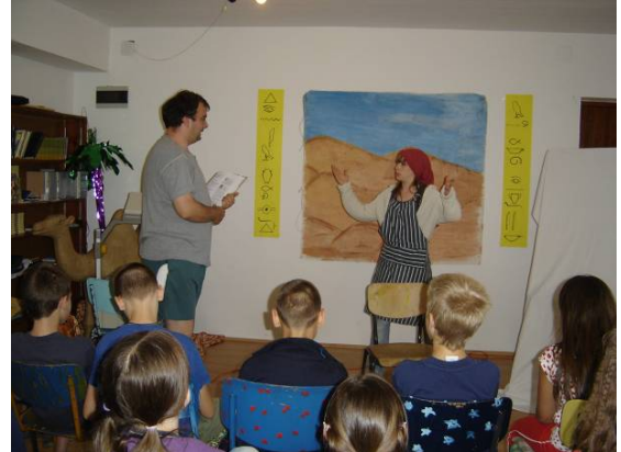
Camp d'été 2007

En avril et mai, nous préparons la saison des camps pour cet été. Pendant cette période nous aurons des week-ends de préparation pour les directeurs et nous préparons la maison pour les camps. Prions pour que nous trouvions et formions les directeurs qui rendront les camps de cette année mémorables pour les enfants et les jeunes.