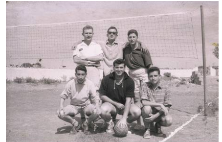
Camp Carrascal en 1950

En 1949, la Ligue Portugal organisait le premier camp. Cette année, nous célébrons l'anniversaire de ses 59 ans. Le 16 février avec plusieurs églises et personnes, nous remercierons Dieu pour les vies qui ont été changées pendant ces 59 années de ministère au Portugal.