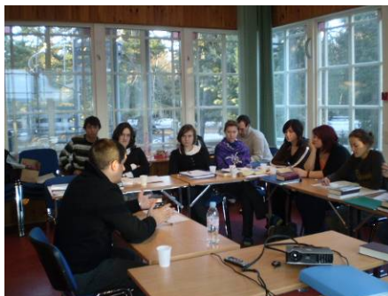
Les Facilitateurs de White rose Fellowship