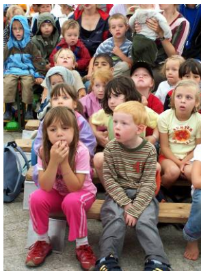
Enfants écoutant attentivement une histoire dans le cadre de la Mission sur la plage

Le personnel : Nous sommes reconnaissants pour les nouveaux qui nous ont rejoints en fin d'année dernière et qui ont commencé leur travail avec beaucoup d'enthousiasme. Nous cherchons toujours trois personnes pour les Editions pour enfants et adolescents et pour le guide enfants « Guter Start ».